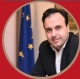
Δημήτρης Παπαστεργίου Υπουργός Ψηφιακής Διακυβέρνησης