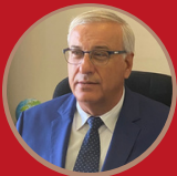
Μιχάλης Σταυριανουδάκης Γενικός Γραμματέας Αυτοδιοίκησης & Αποκέντρωσης